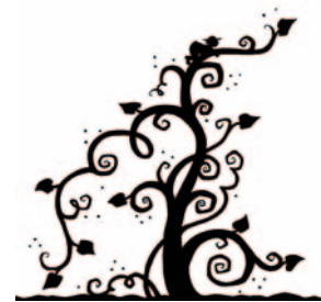
¿Juanito y las habichuelas mágicas?