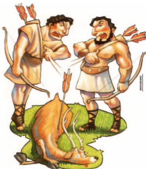
Muy Interesante nº 331, Pág. 91

Cuestiones complementarias: Excepcionalmente, si el alumno o la alumna no fuera capaz de elaborar autónomamente la descripción y/o la narración, la persona encargada de la evaluación puede darle algunas orientaciones: