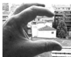
Enquadrant en horitzontal

• És molt difícil “veure una foto” mirant el conjunt. Es pot fer, naturalment, des del visor o la pantalla de la càmera, però de vegades no la portem i tenim necessitat de saber com ens quedaria la foto. O, simplement, volem veure-la abans de fer-la. Les nostres mans ens poden servir per enquadrar .