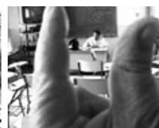
Enquadrant en vertical

• Abans de disparar mira el fons i confirma que no hi ha un batibull d’elements. Si és així, et pots ajupir una mica i fer la foto en contrapicat , és a dir, de baix cap a dalt. Més val que es vegi una mica de cel blau que no elements que ens distreuen del punt d’atenció. • Si les persones estan perfilades sobre un cel blanc, és millor fer la foto més de prop o alçar-se més per evitar un contrallum. Pensa que les càmeres digitals -igual que les de vídeo- prenen la referència de la llum a partir dels punts més lluminosos de la imatge.