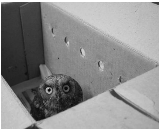
Autillo (Otus scops) acabado de llegar al centro para que lo curen.

Afortunadamente, existen lugares denominados CENTROS DE RECUPERACIÓN, como por ejemplo el del COFIB , donde podemos llevar el animal que hemos encontrado, para que su equipo de biólogos y veterinarios se haga cargo, con la intención de curar sus heridas y acogerlo en sus instalaciones hasta que esté completamente recuperado.