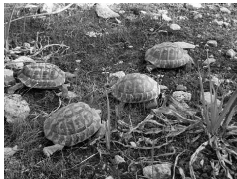
Liberación de tortugas mediterráneas (Testudo hermanni) procedentes de particulares.

INFORMACIÓN DE INTERÉS: En Mallorca, el centro de recuperación de fauna del COFIB lo encontraréis en: