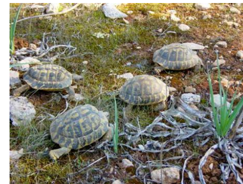
Liberación de tortugas mediterráneas (Testudo hermanni) procedentes de particulares.

INFORMACIÓN DE INTERÉS: En Mallorca, el centro de recuperación de fauna del COFIB lo encontraréis en: