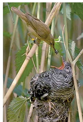
La busqueta alimentant la cria de cucut

La busqueta és un animal tan distret i ingenu que no s'adona del canvi que li han fet. Amb la mateixa constància amb què hauria incubat els seus ous, la busqueta cova l'ou del cucut, fins que arriba el moment en què es produeix el tràgic descobriment. És quan la closca de l'ou es trenca i la busqueta veu aparèixer, en el seu niu, un animal estrany, negre, amb un bec enorme,