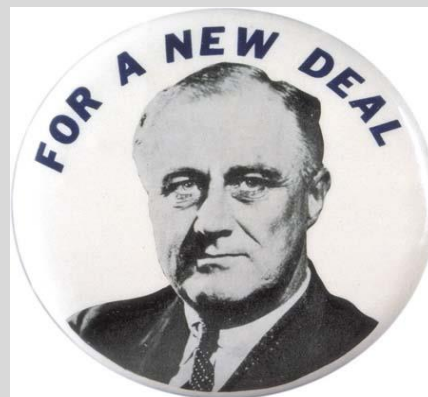
Imagen propagandística de F. D. Roosevelt (1932)