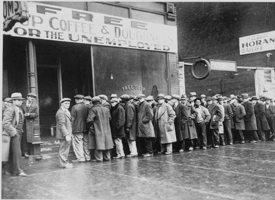
Cola de desempleados. Chicago 1931