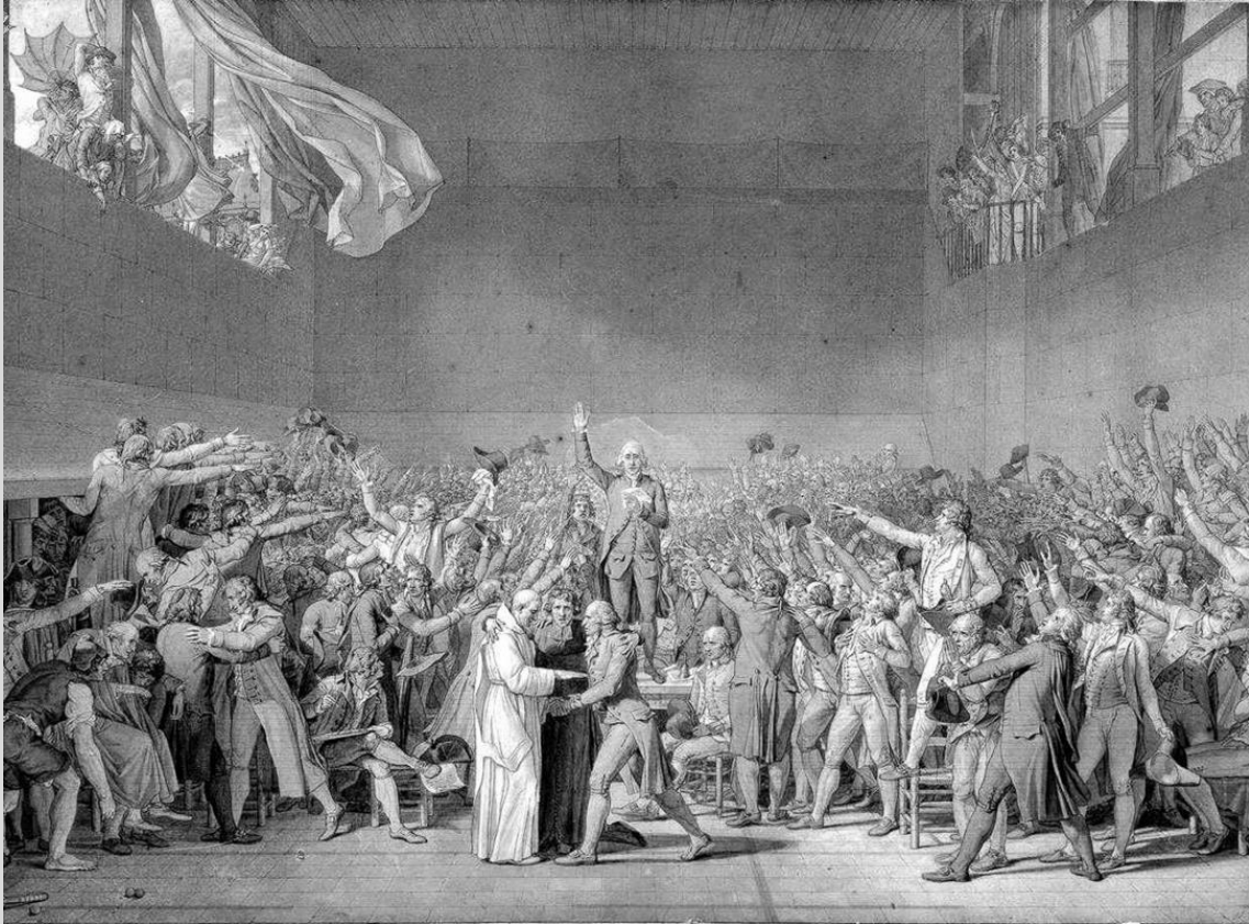
El juramento del Juego de Pelota (grabado de J.L David, 1791)

https://es.wikipedia.org/wiki/Archivo:Le Serment du Jeu de paume.jpg